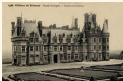
Façade principale du château de Trévez, vers 1910

Jusqu'alors caché par une opaque végétation, le château s'offre enfin aux yeux des invités. Trois « fenêtres » pratiquées dans des bosquets aux couleurs variées magnifient successivement le monument entier, puis les espaces destinés aux invités à l'ouest et enfin, à l'est, les appartements de James de Kerjégu et de sa fille la marquise Françoise de La Ferronnays. Face au château, le jardin régulier a été partiellement restitué : les parterres symétriques, à l'origine fleuris, ont été plantés de santoline. Les camélias qui l'entourent ont été taillés en 2007, pour la première fois depuis cent ans.