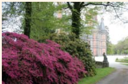
Azalées Amoenum en fleurs en mai