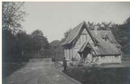
Façade sud de la maison de garde Vein Rouz, vers 1910 (CDP29)

Aujourd'hui, vous êtes entré dans le domaine par l'est, une porte autrefois réservée aux charrettes. Au début du 20 e siècle, Trévarez comportait trois entrées d'honneur pour les propriétaires et leurs invités : celle-ci au sud, une autre au nord, et une dernière à l'ouest. Comme les autres, l'entrée sud est surveillée par une maison de garde en briques, granit de Scaër et pierre de Kersanton, matériaux que l'on retrouve dans tous les bâtiments du domaine. Elle est fermée par un portail en fer forgé proche de ceux qui ornent le château de Courances en Essonne, propriété du beau-père de James de Kérjégu restaurée par les Destailleux, architectes de Trévarez. Enfin, elle mène à l'allée carrossable, recouverte de son macadam originel, qui descend vers le château.